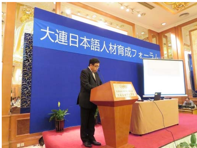
丸山首席代表致词