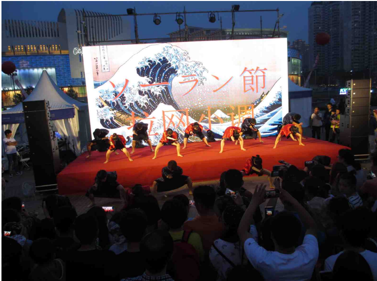
大连留学生社团带来的拉网小调