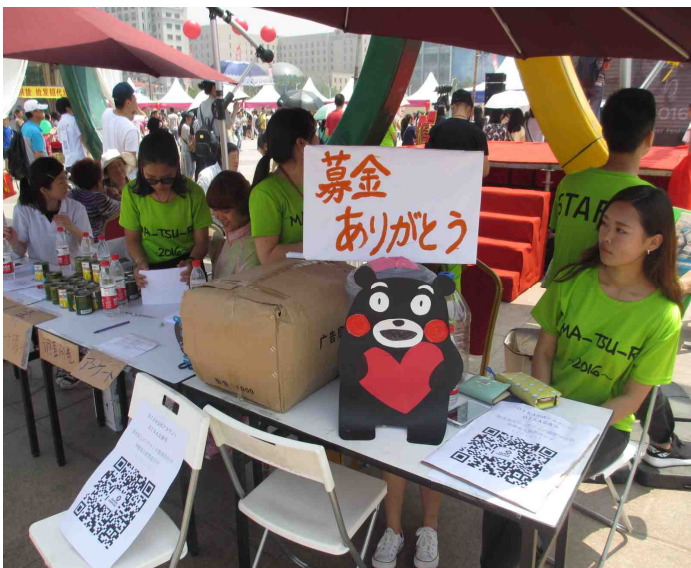
调查问卷及熊本地震捐款展台