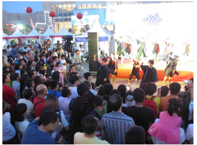
欣赏拉网小调的市民