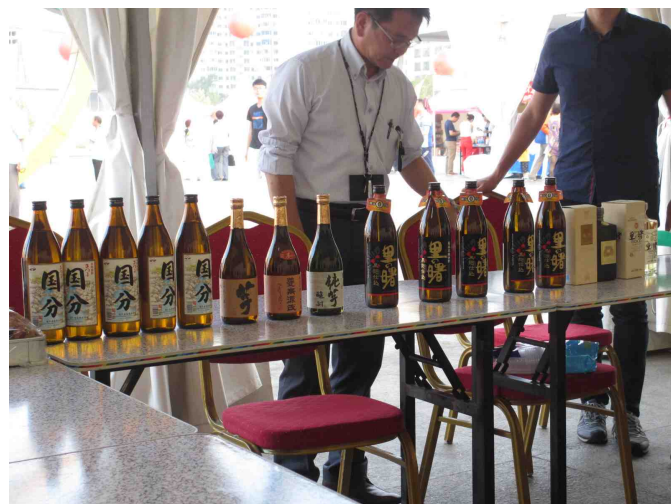
邀请市政府及同行代表举行的日本烧酒试饮会