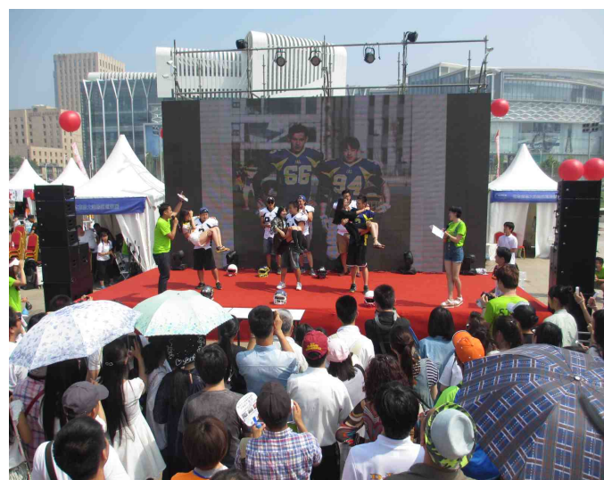
舞台⑤（中日混合美式足球队）