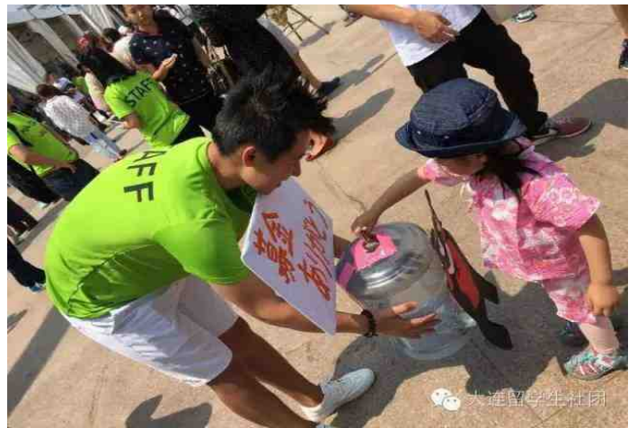
为灾区募捐的志愿者