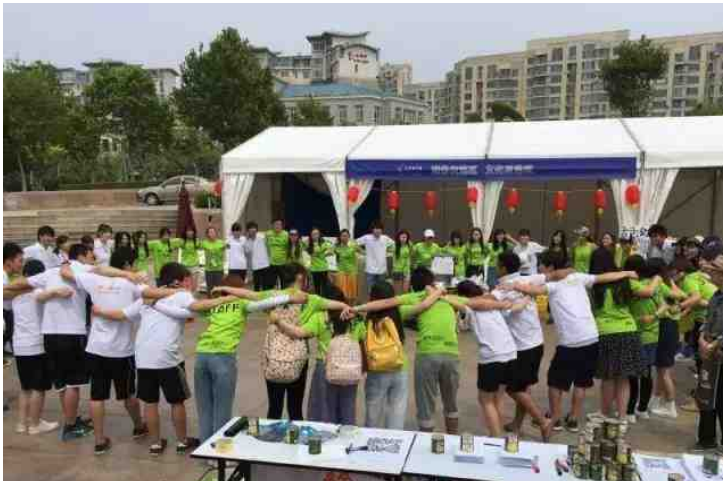
围成圆圈的日本留学生和中国学生志愿者