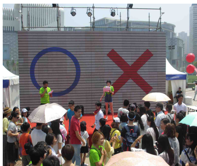
舞台④（日中对错智力竞赛）