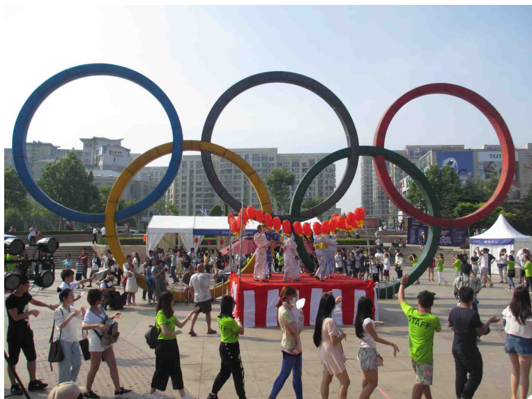
孟兰盆节舞蹈④（在表演台上跳舞的浴衣美女大赛参赛者）