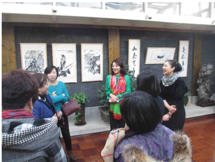
講座終了後、参加者からの質問に答える東講師