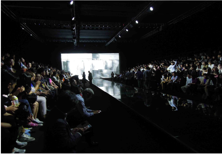
満席となったショー会場