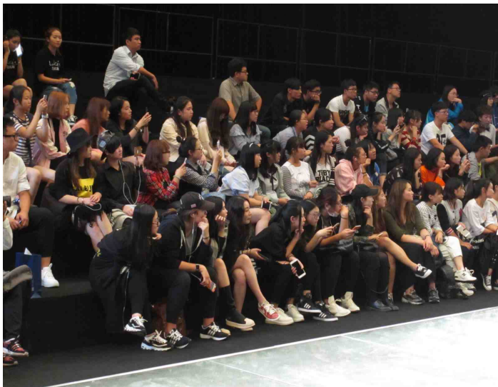
真剣な目でリハーサルに見入る学生たち①