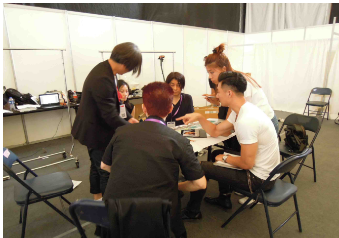
ショー構成の打ち合わせ