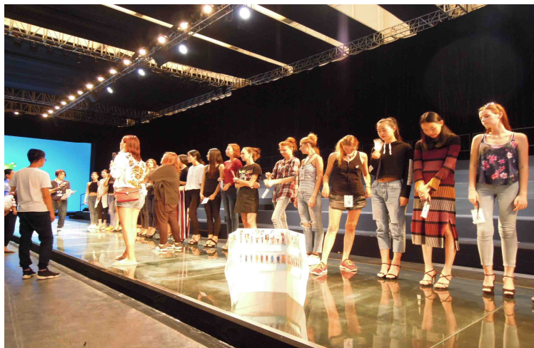
モデルオーディション①