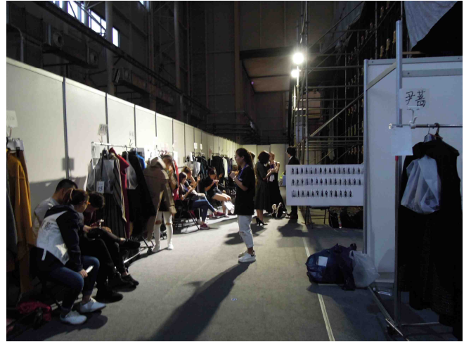
バックステージの様子