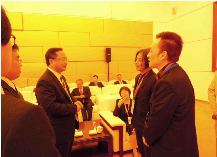
唐軍・大連市共産党委員会書記への挨拶