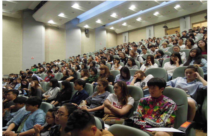
ファッション・デザイン講義②（鲁迅美术学院）