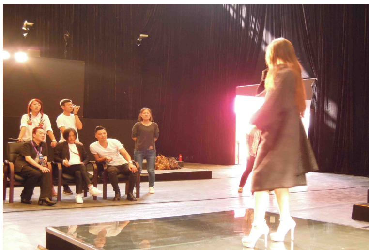
モデルオーディション②