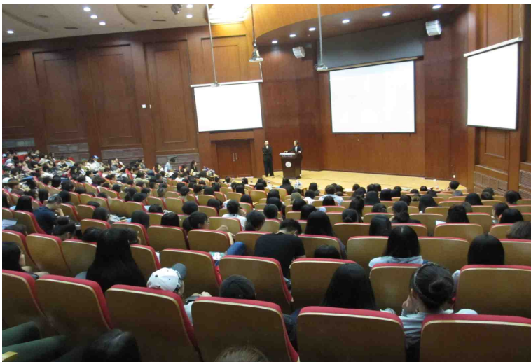
ファッション・デザイン講義③（大連工業大学）